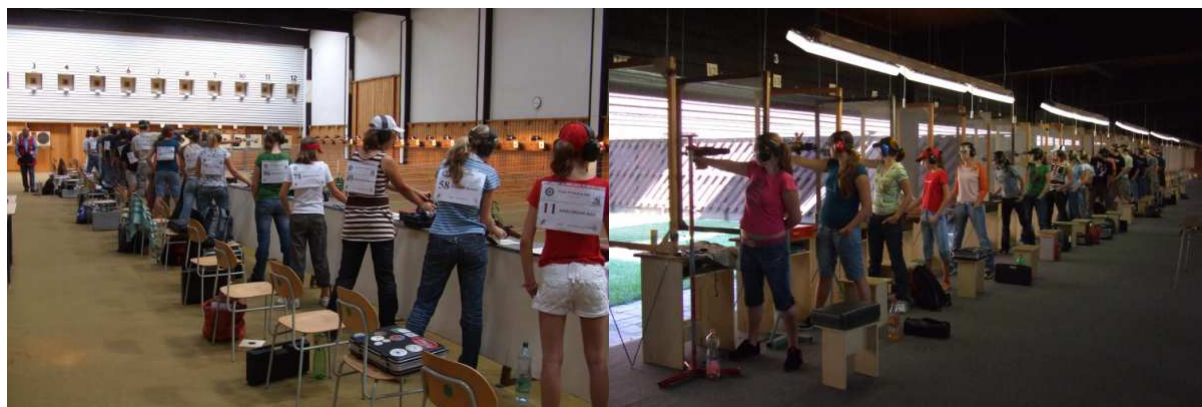
pistolářky v hale při VzPi