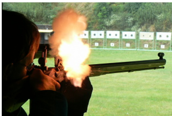
a křesadlové pušky