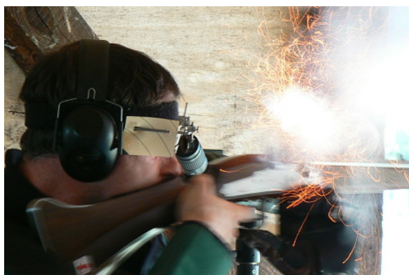
- střela již proletěla terčem a nad zbraní ještě krouží spousta jisker

Balákův výsledek 97 bodů je ale důkazem toho, že i přes jistou primitivnost těchto zbraní s nimi dobrý střelec dokáže docílit vynikajícího nástřelu.