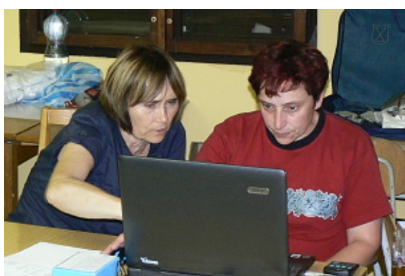
i při nezbytné administrativní práci