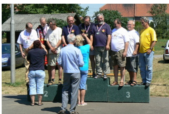
Horko bylo při dekorování vítězů