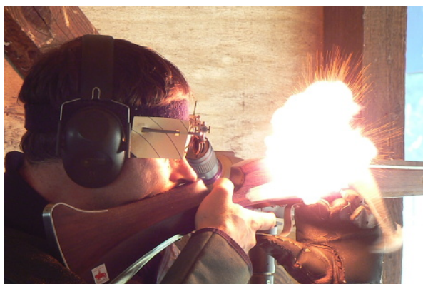
- počátek zážehu -