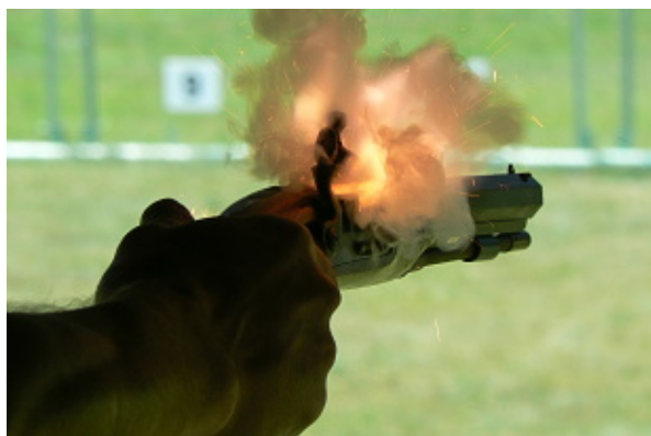
Vznícení prachu na pánvičce křesadlové pistole

Letošní mistrovství probíhalo za úmorného dvaatřicetistupňového vedra a tak se důkladně zapotili nejenom puškaři ve svých kabátech, ale i pistoláři, pořadatelé a rozhodčí. Těm všem patří poděkování za bezproblémový a hladký průběh celé akce.