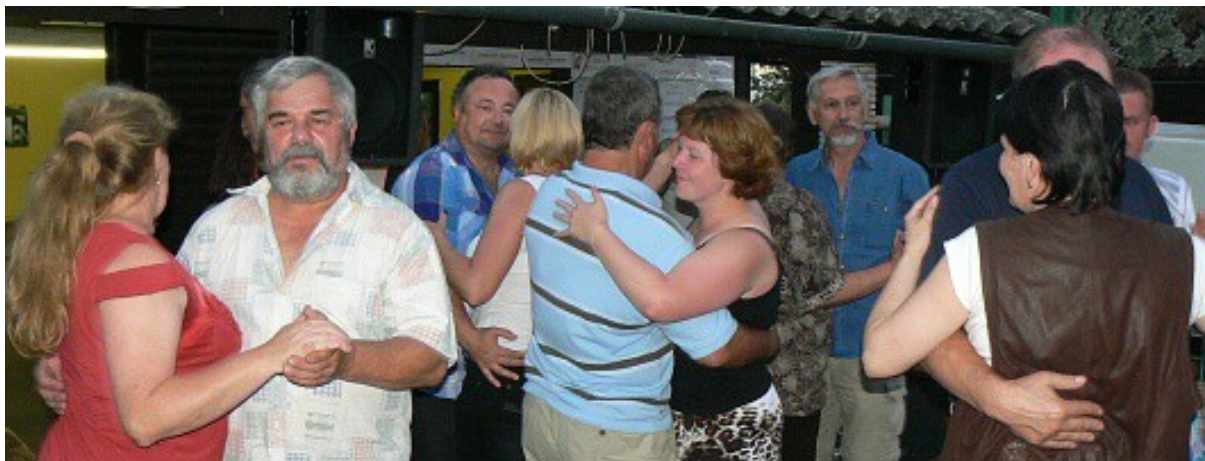
Střelci to umí nejenom se zbraněmi, ale roztácejí to i na parketu

Ostrožští pořadatelé se vždy starají nejen o zajištění samotných soutěží, ale i o následnou pohodu pro všechny zúčastněné. Dobrá kuchyně, dobré víno, živá hudba, tanec – to patří k místním zvyklostem.