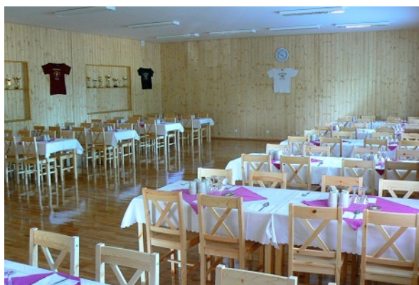
Společenská místnost či 10 metrová střelnice