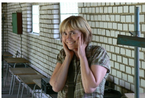
a odborná kontrola na střelišti