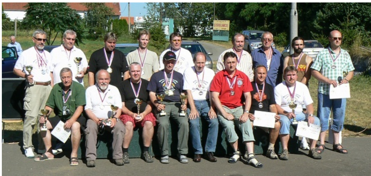
Medailisté z krátkých zbraní