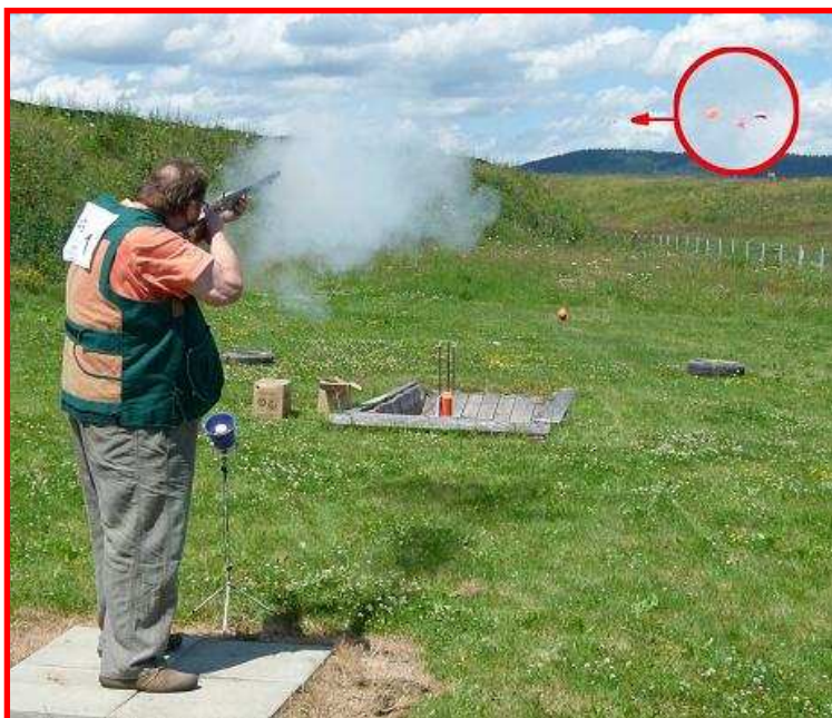
.....a jeden z jeho devatenácti zásahů