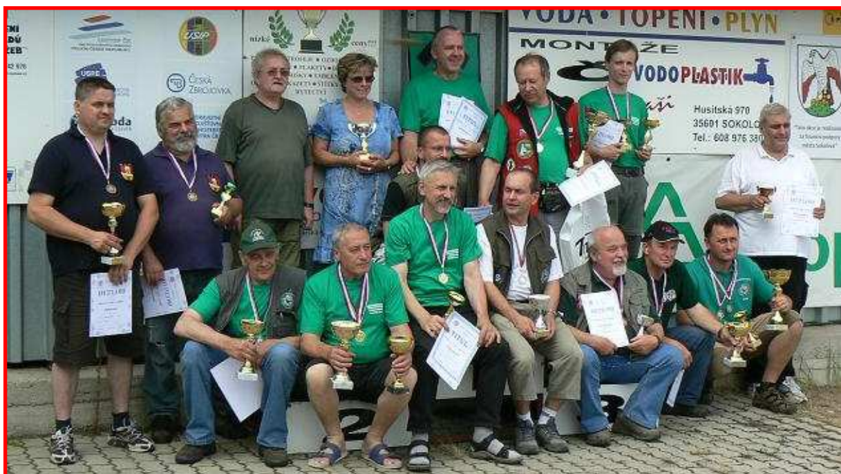
Nejlepší ve střelbě z krátkých zbraní.....