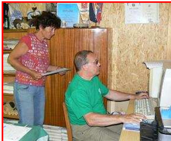
Výsledky jsou sečteny, diplomy napsány a nadešel čas vyhlášení výsledků.