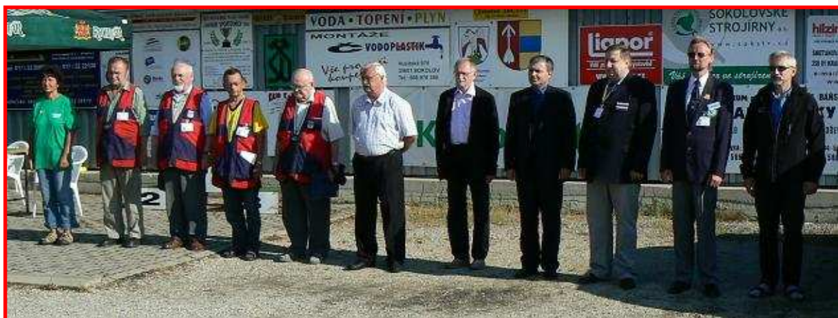
Hlavní funkcionáři a rozhodčí mistrovství při jeho slavnostním zahájení

Ve dnech 9. a 10. července proběhlo na střelnici v Lomnici u Sokolova Mistrovství České republiky 2011 ve sportovní střelbě z předovek, o jehož uspořádání se v rámci Českého střeleckého svazu opět po dvou letech úspěšně postarali členové SSKP Sokolov. Po loňském představení byly do programu zařazeny i disciplíny Tanzutsu a Tanegashima ve střelbě doutnákovou pistolí a puškou, a tak letos již střelci bojovali o dvanáct mistrovských titulů v pěti disciplínách z krátkých a sedmi z dlouhých perkusních a křesadlových zbraní.