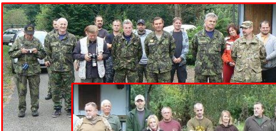
Závodníci nastoupili k slavnostnímu zahájení mistrovství

Týden po mistrovství velkorážní puškou na mizivé cíle si své síly a dovednost změřili střelci i malorážkou. V těchto disciplínách se úměrně zmenšené terče, umístěné ve vzdálenosti 17, 33 a 50 metrů od palebné čáry, ukazují ve stejných časech jako pro velkorážní pušku, jen ve třetí části závodu se střílí o čtyři soutěžní rány víc.