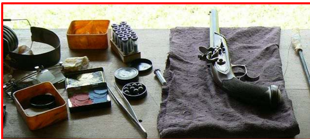
Střelecké náčiní připravené k použití

Se závěrem hlavní předovkářské sezóny byla ukončena i Česká střelecká liga z předovek pro rok 2012. Tu vyhlásil Český střelecký svaz ve dvanácti disciplínách ve sportovní střelbě z perkusních revolverů, perkusních, křesadlových a doutnákových pistolí a pušek a perkusních brokovnic. Více než 2700 zaznamenaných výsledků, nastřílených 138 střelci z 59 střeleckých klubů na soutěžích domácích i zahraničních uvedených v kalendáři akcí ČSS, se promítlo do hodnocení této celoroční soutěže a poskytlo přehled o výkonnosti všech našich předovkářů střílejících soutěže v souladu s mezinárodními pravidly MLAIC. Podmínky pro zařazení do výsledkové listiny ligy splnilo 98 střelců, mezi nimi jsou však pouze tři ženy.