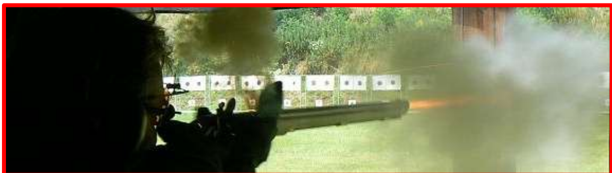
Vyfotit letící střelu se mi stále nějak nedaří