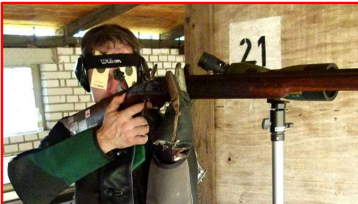
Před hořícím prachem na pánvičce je dobré se chránit

Na rozdíl od jiných disciplín soutěží předovkáři v jedné společné věkové kategorii a navíc ženy společně s muži. Není mnoho sportovních odvětví, kde by bylo tak velké věkové rozpětí závodníků a tak vysoký věk těch aktivních a úspěšných, kteří se utkávají mezi sebou.