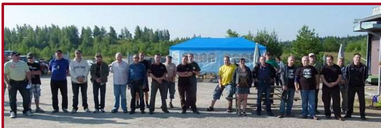
...a závodníci při slavnostním zahájení mistrovství.