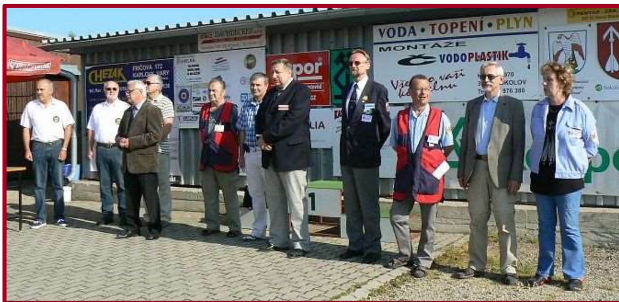
Pořadatelé, funkcionáři, rozhodčí....