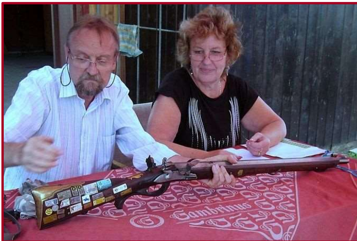
Kontrola originální křesadlové pušky dopadla dobře.

Ustálenému programu soutěží předcházela technická přejímka zbraní, která započala již v pátek zároveň s prezentací závodníků. Jedinou zbraní, která letos nebyla připuštěna ke střelbě, byl revolver se špatně fungující aretační západkou.