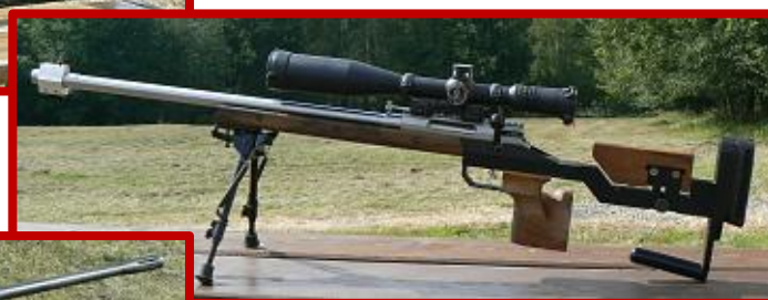
SIG SAUER SSG 3000