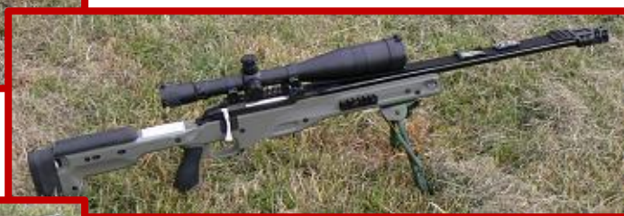
TIKKA T 3