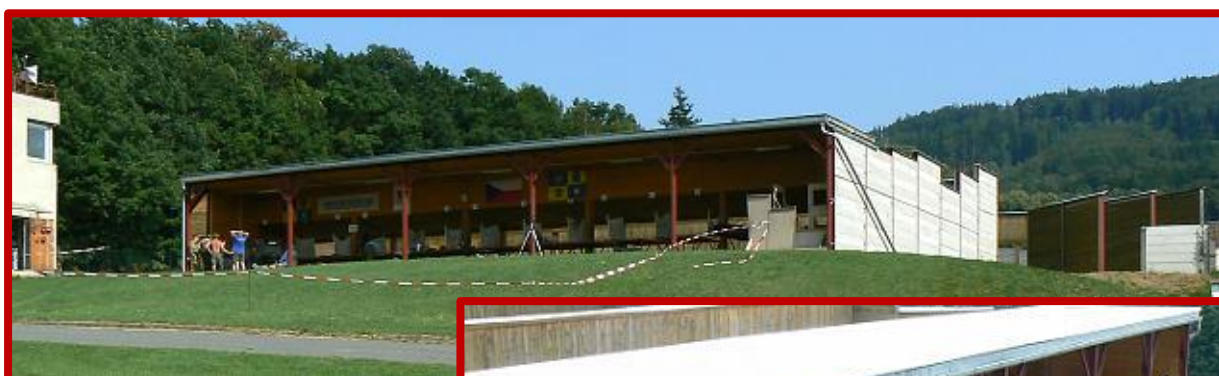
Střelnice v Dobroticích

Střelci si tak mohli po loňských téměř bojových podmínkách polní střelnice užít komfortu střeleckých stolů a krytého střeliště. To společně s celodenním mírně podmračeným a téměř bezvětrným počasím dávalo dobré podmínky ke skvělým výkonům, které se také dostavily v podobě překonání hned pěti rekordů ČR.