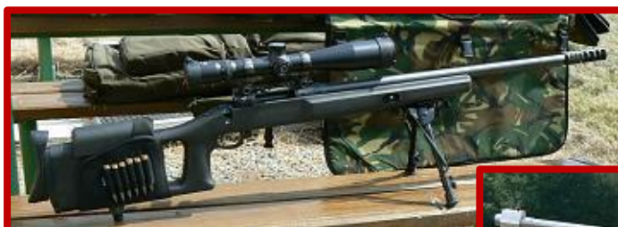
SAVAGE mod. 10

Mistrovství proběhlo bez zádrhelů a problémů, poslední výstřely však padaly již za soumraku a tak vyhlášení výsledků se zakončením proběhlo až po setmění. Mistrovské soutěže měly tentokrát opravdu vysokou úroveň, což dokládá pětice dosažených rekordů, které se budou v některých případech těžko překonávat. Vždyť výsledky Škorpila se Staňkem jsou jen sedm, respektive osm bodů pod maximem 460 bodů.