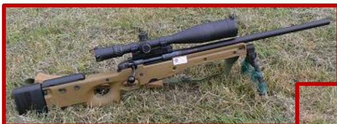
REMINGTON mod. 700

Kvalitní zbraň si vyžaduje i kvalitní puškohled