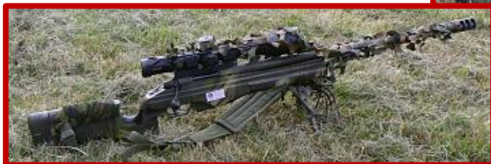
SAKO TRG 22

Nejpoužívanějším nábojem byl .308 W následovaný .223 Rem, 6 mm Norma BR a v ojedinělých případech 7,5x55 Swiss, 6,5x55 SE nebo 7,62x54 R.