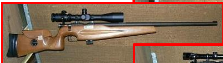
CZ ZKM 456-4