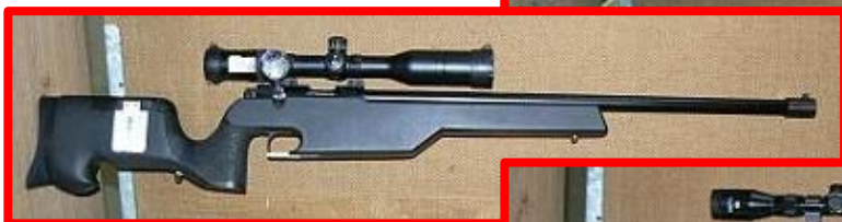
Anschütz 1413 s pažbou pro BT