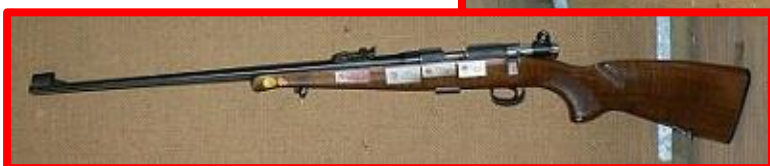
CZ ZKM 452-2E s levostranným závěrem