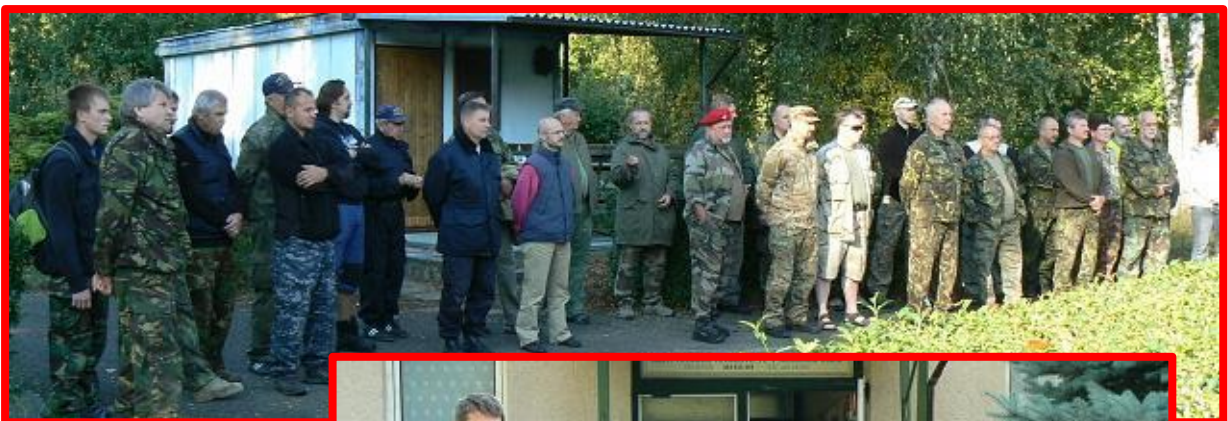
Nástup střelců ke slavnostnímu zahájení mistrovství

Čtrnáct dní po mistrovství velkorážní puškou na mizivé cíle do 300 metrů bojovali střelci o tituly mistrů republiky i malorážkou. V disciplíně s puškohledem startovalo třicet mužů a v samostatné kategorii pět žen a jeden dorostenec. S otevřenými mířidly pak jedenáct mužů společně s jednou ženou.