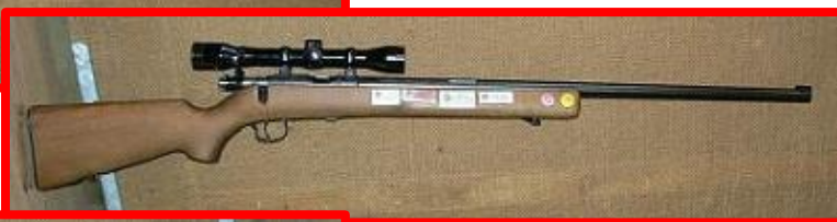
CZ ZKM 456