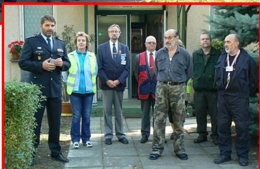
Pořadatelé, rozhodčí a ředitel soutěže vítají účastníky