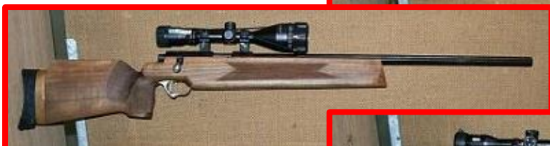
Suhl 150 Standard