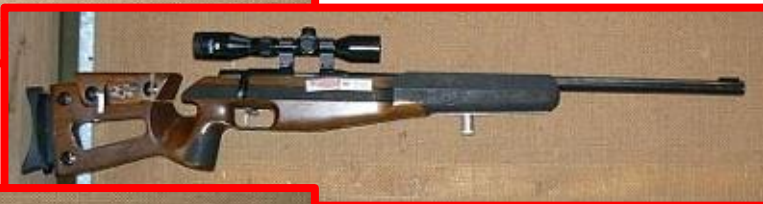
VOSTOK Ural 2