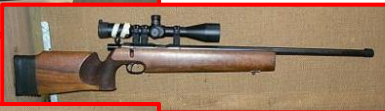
Walther UIT - Special