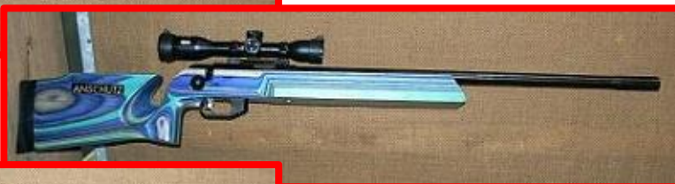
Anschütz 1913 A