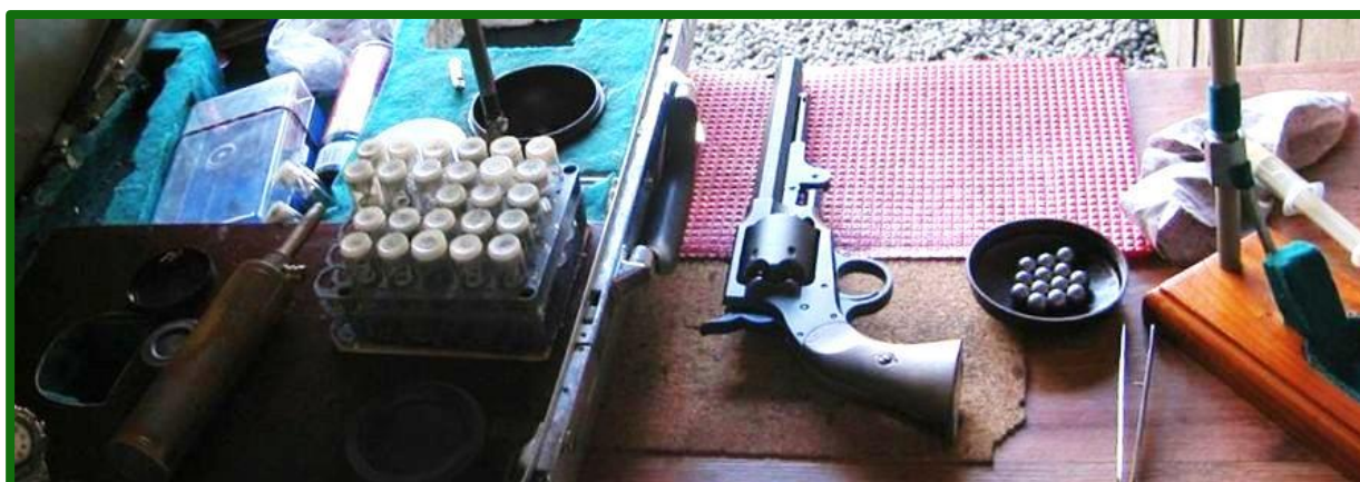
Replika revolveru Rogers & Spencer s příslušným „nádobíčkem“ potřebným pro závod

Skončila hlavní předovkářská sezóna a s ní byla ukončena i Česká střelecká liga z předovek pro rok 2013. I v letošním roce ji vyhlásil Český střelecký svaz ve dvanácti disciplínách ve sportovní střelbě z perkusních revolverů, perkusních, křesadlových a doutnákových pistolí a pušek a perkusních brokovnic. Do hodnocení této celoroční soutěže se promítlo téměř 2100 zaznamenaných výsledků z 268 výsledkových listin jednotlivých závodů, nastřílených 129 střelci z 51 střeleckých klubů na 38 domácích i zahraničních soutěžích uvedených v kalendáři akcí ČSS. Toto hodnocení poskytuje ucelený přehled o výkonnosti všech našich předovkářů střílejících soutěže v souladu s mezinárodními pravidly MLAIC. Podmínky pro zařazení do výsledkové listiny ligy splnilo 79 střelců, mezi nimi jsou však pouze tři ženy.