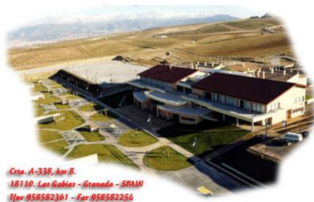
Crta. A-338, km 8. 18110. Las Gabias - Granada - SPAIN Tlmo 958582361 - Fax 958582256