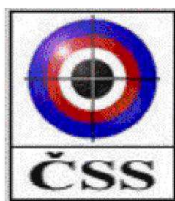
č. ZO 0159