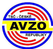
č. ZO 50023