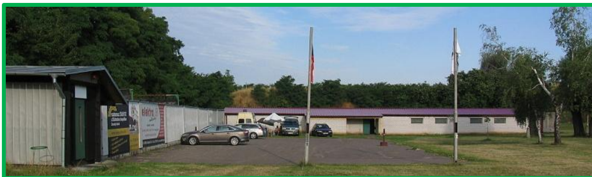
Střelnice SSK Uherský Ostroh