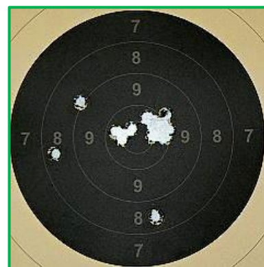
99 bodů Pyszneho ve Whitworth