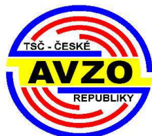
č. ZO 50023