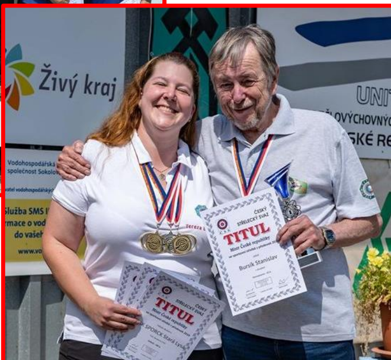
Medailisté puškových disciplín