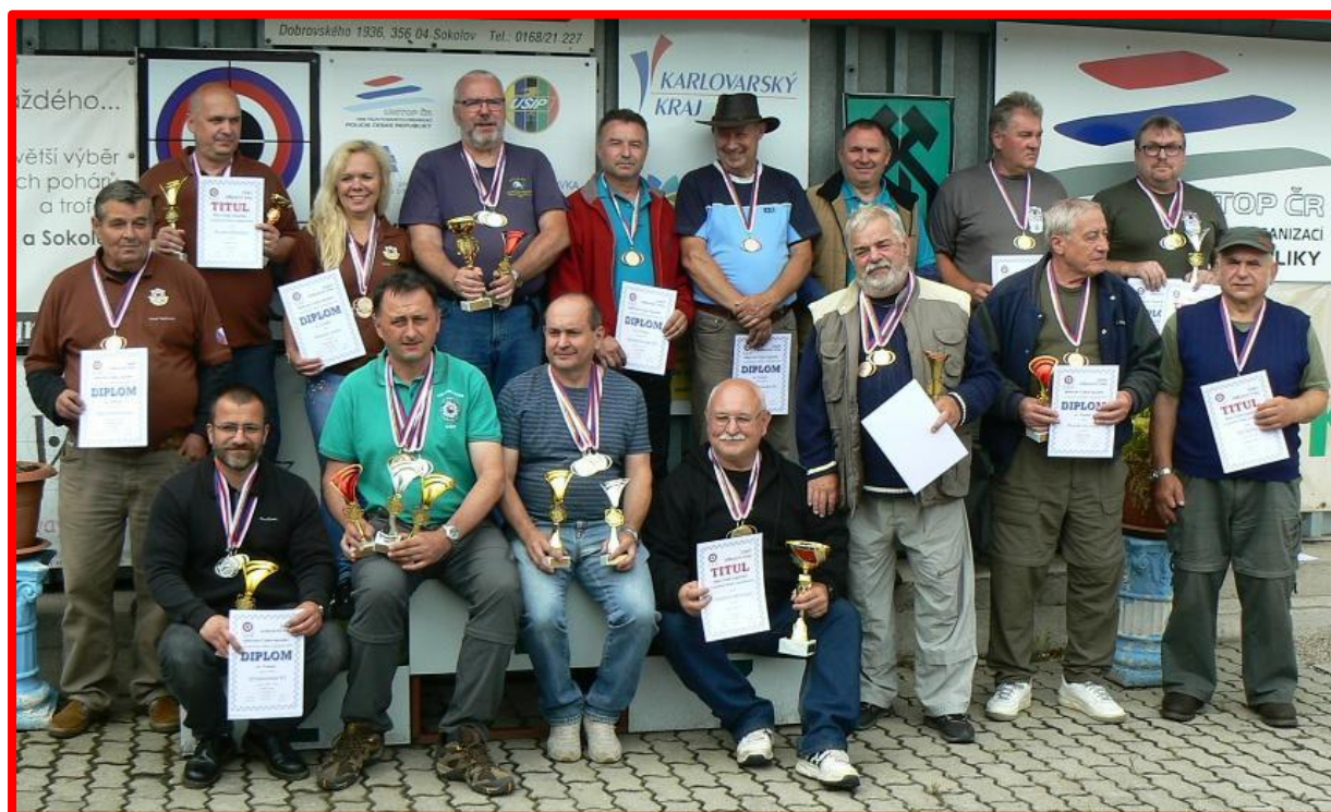
Společné foto medailistů prvního dne mistrovství.