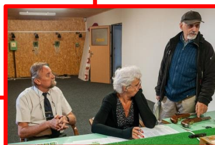
Civilní perkusní pistole Lyman Great Plains pistol .54.

rický vzor a nesmí být nijak upravené. To se týká pušek i pistolí a jejich replik.