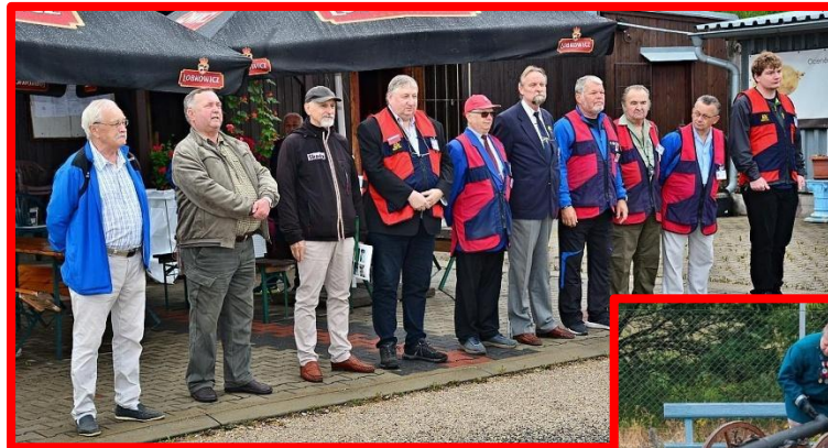
Slavnostní zahájení mistrovství, nástup střelců a rozhodčích