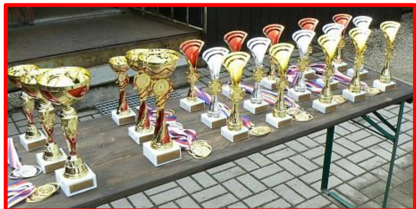
První poháry a medaile už se těší na své budoucí majitele.