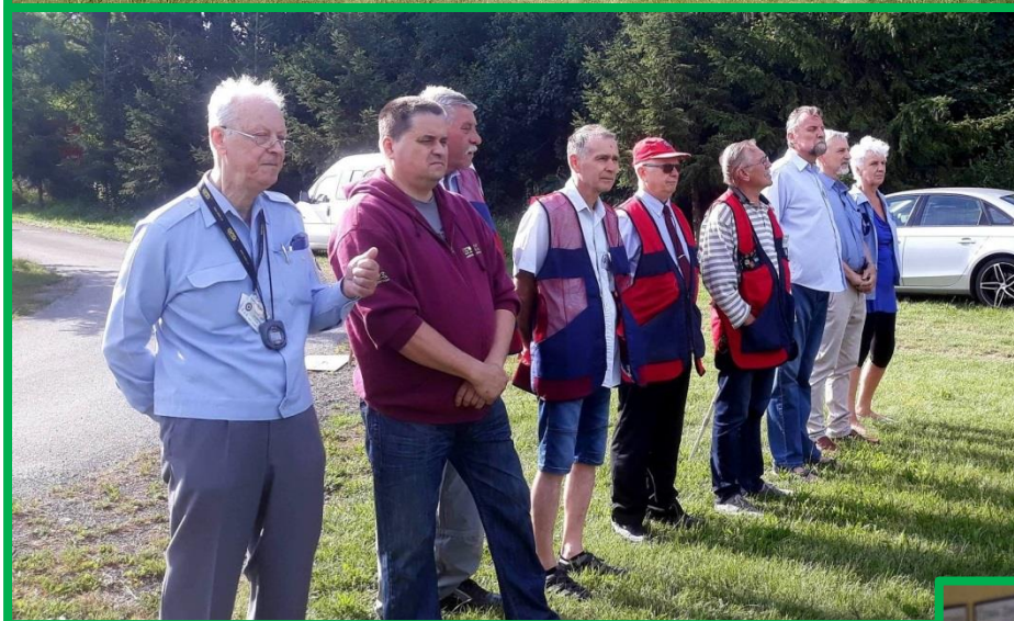
Závodníci, ředitel mistrovství a rozhodčí při slavnostním zahájení