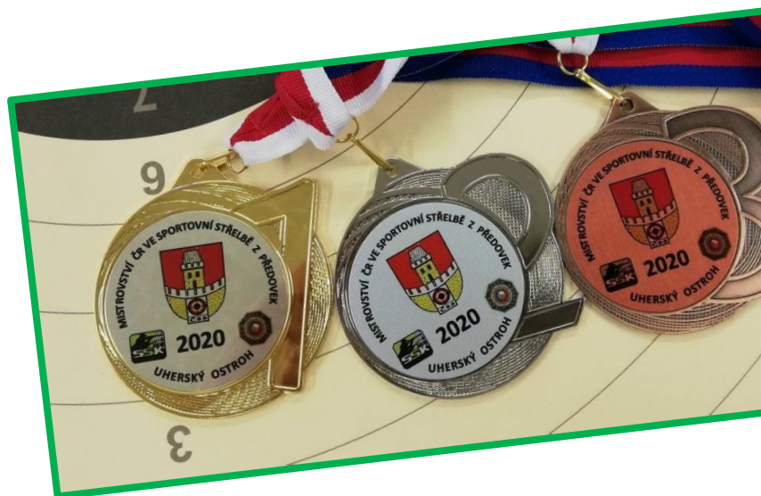
Ocenění pro nejlepší již čekají na své nové majitele