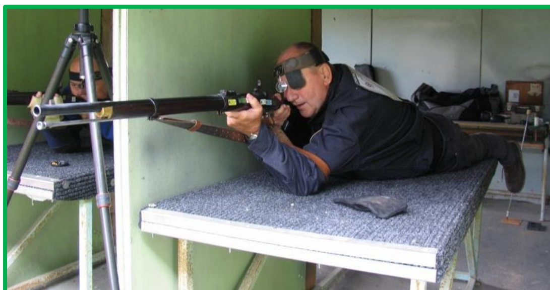
Střelba vleže na sto metrů znamená po každém nabití vylézt se zbraní na střelecký stůl, po výstřelu zase slézt... Je to takový malý tělocvik.