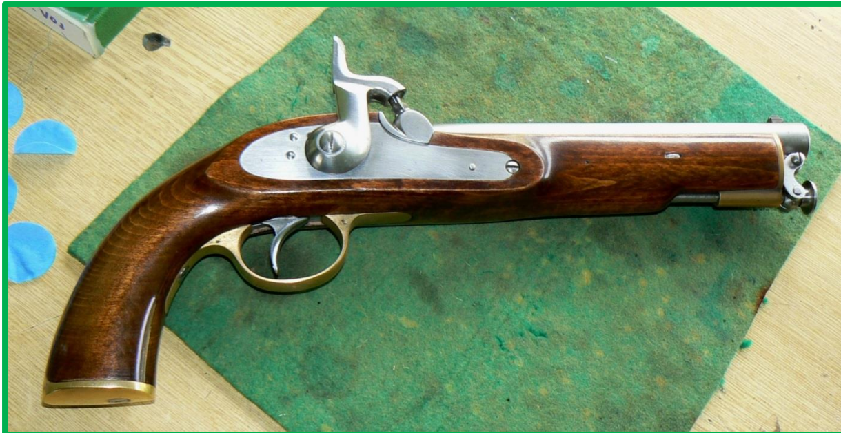
Replika britské jezdecké pistole Tower 1859 (navržena v roce 1842)

Součástí každého mistrovství je samozřejmě nejprve přejímka zbraní, které musí být buď historické originály, nebo jejich repliky. Výzbroj našich střelců je už delší dobu poměrně ustálená a novinky se objevují jen zřídka. Mezi ty letošní patří dvě pistole pro disciplínu Lorenz, tedy vojenské perkusní pistole. Slovem vojenské se rozumí takové, které byly zařazeny do výzbroje nějaké armády jako definovaný vzor.