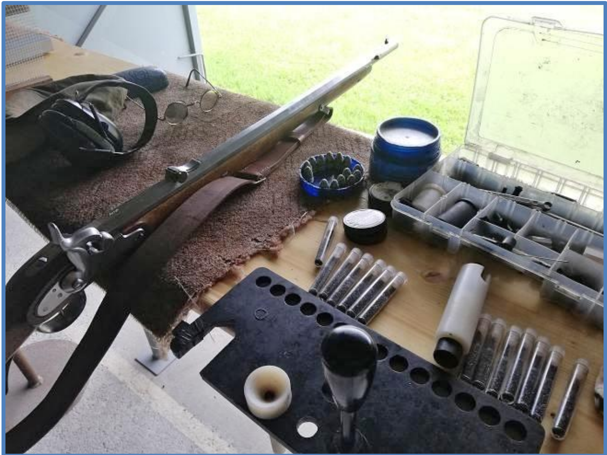
Disciplína Lamarmora a připravená replika rakouského mysliveckého štuca Lorenz vzor 1854