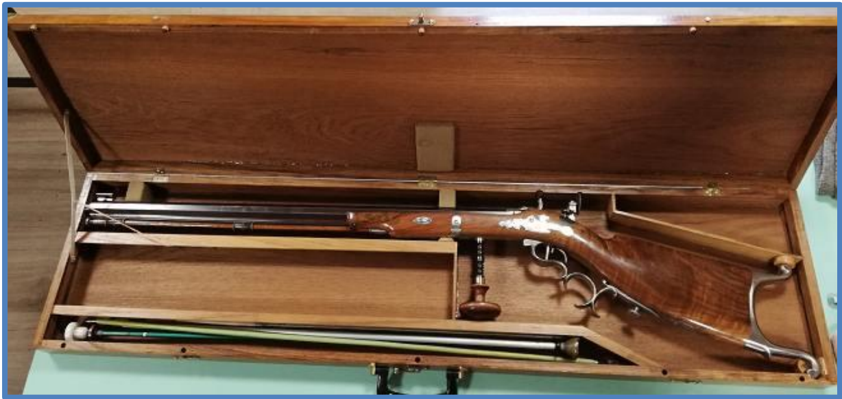
Transportní kufr s perkusní terčovnicí