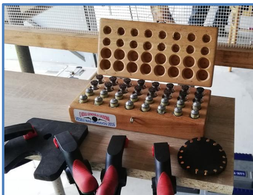
Uložení střel a dávek prachu proti poškození přepravou.

U předovek totiž platí, že byt' by byly hlavně z jedné série a ve stejných zbraňích, nabíjí se stejnými střelami, použije se stejné mazání či flastry a stejné dávky prachu, z jedné to bude chodit takzvaně jednou dírou a druhá bude mít rozptyl třeba deset centimetrů. Pro každou zbraň se musí všechny komponenty doladit, někdy stačí jen změnit dávku prachu nebo síly flastru, jindy je potřeba změnit průměr či druh střely.