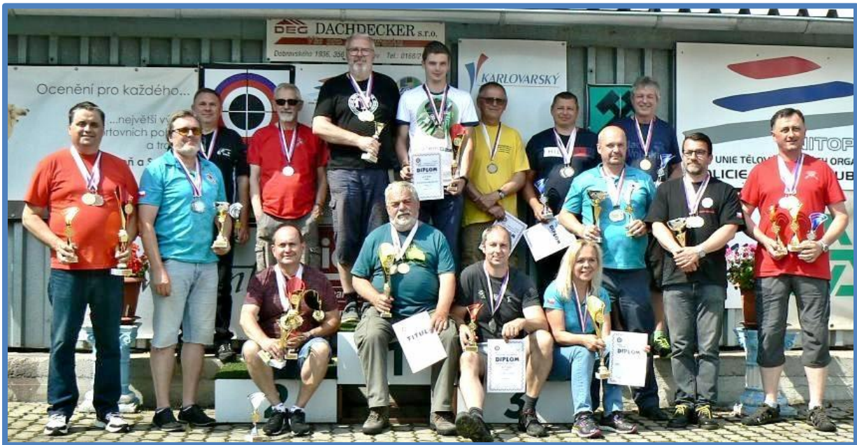
Společné foto medailistů pětadvaceti metrových disciplín

Další sada pohárů a medailí pro vítěze padesáti a sto metrových disciplín druhého dne mistrovství