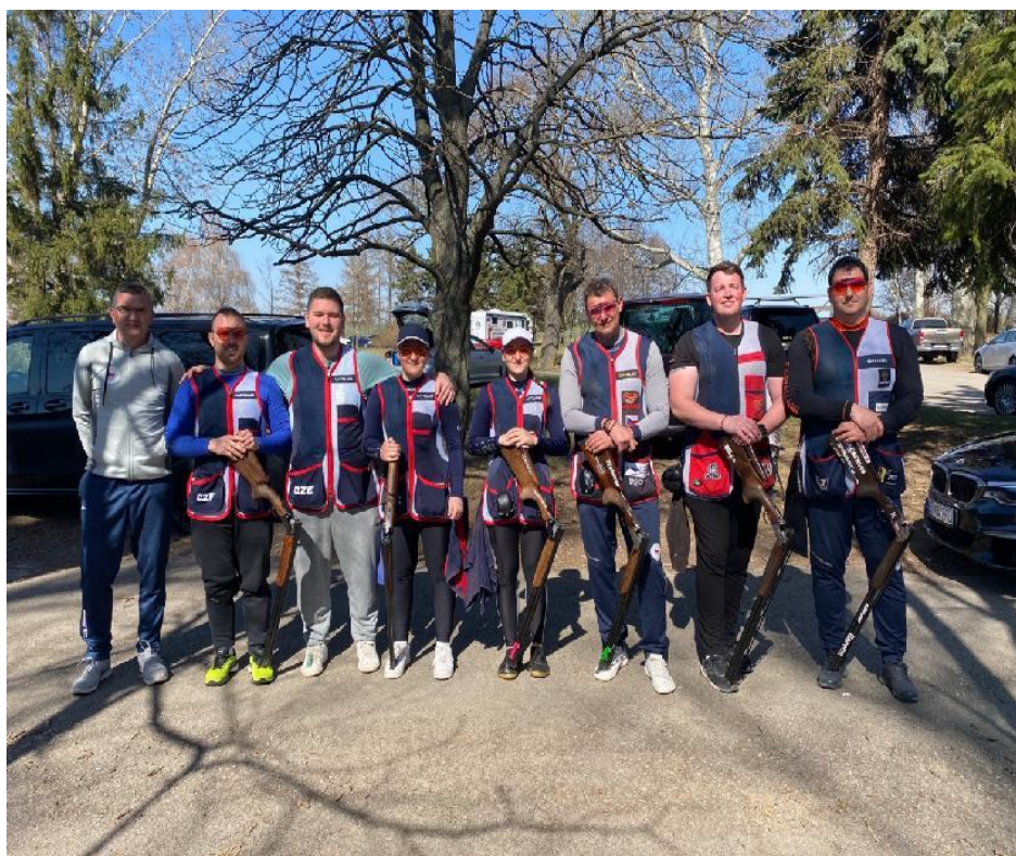
Reprezentace disciplíny Trap