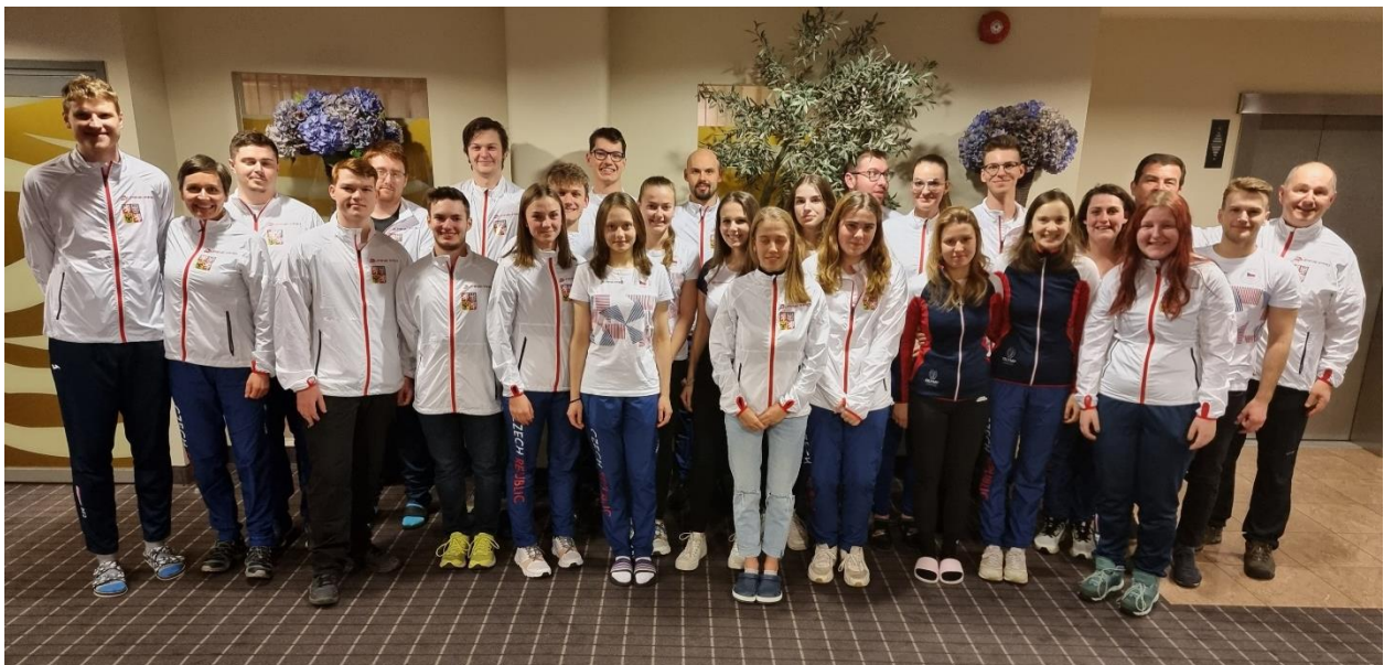
Kompletní výprava České republiky na ME 2023 v Tallinnu

Reprezentační trenér pro pistolové disciplíny