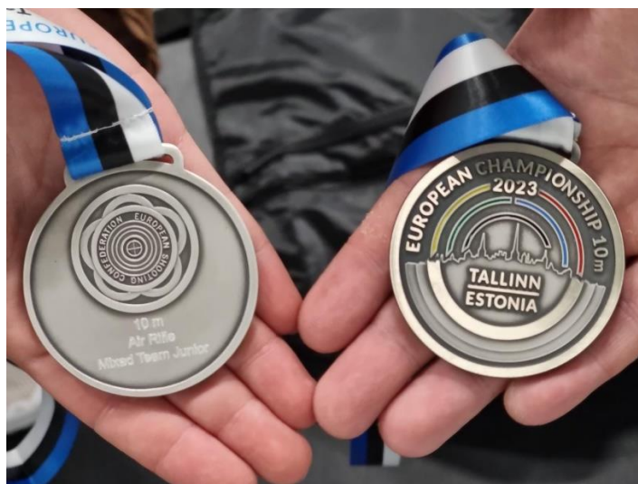
Velmi cenná medaile - v kategorii seniorů to je olympijská disciplína!!!