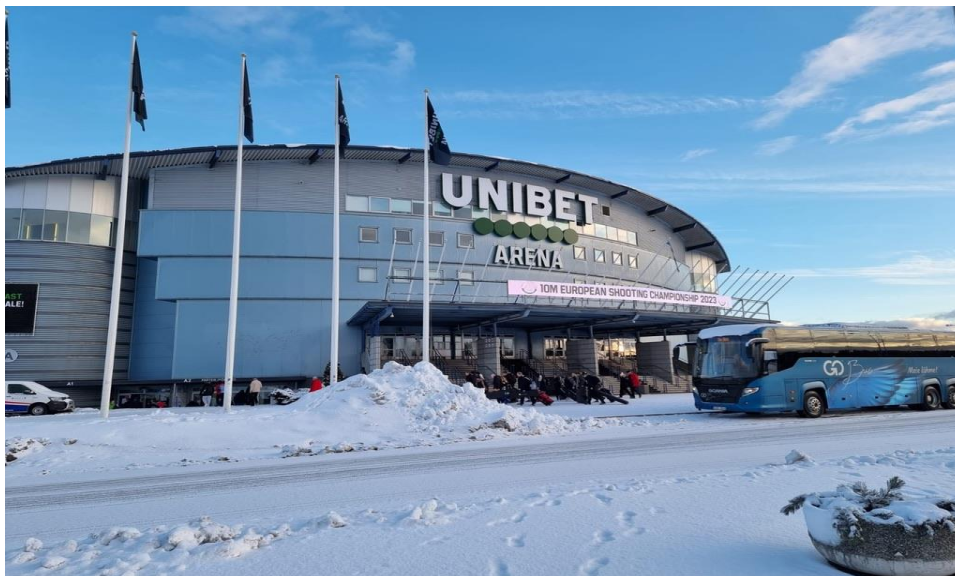
Foto sportovní haly.

Ve dnech 5. - 13. března 2023 se v Estonském Tallinnu uskutečnilo Mistrovství Evropy ve vzduchový zbraních.